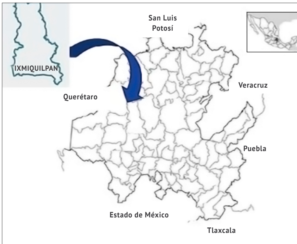
Mapa 1 Ixmiquilpan, Hidalgo